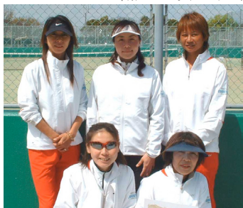
優勝 カクテル企画